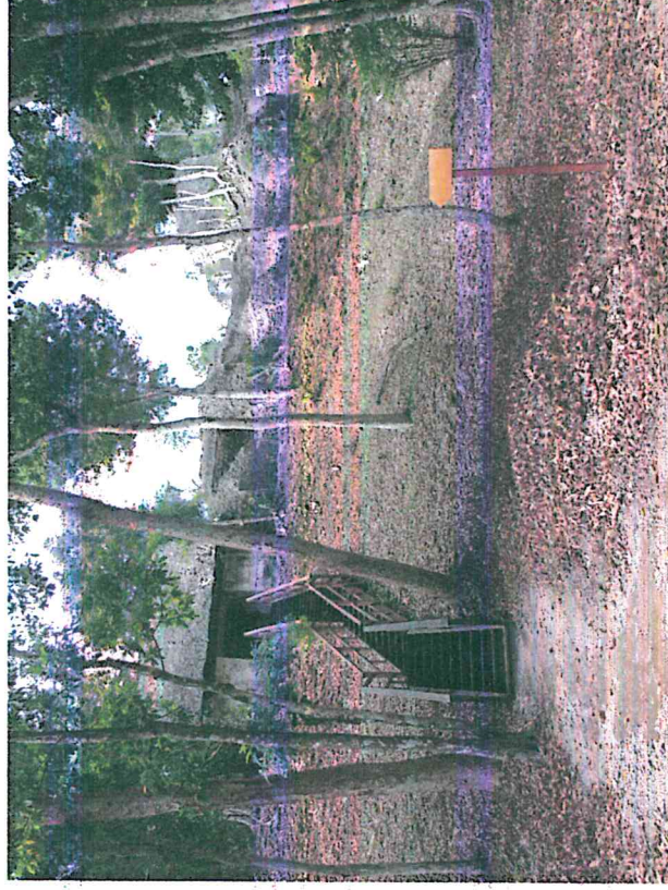
Figura 7: Sitio arqueológico Nakum

Se realizó una visita a Nakum con el fin de realizar un listado de las necesidades de mantenimiento de la infraestructura turística, ranchos del área de campamento, baños y escalinatas.