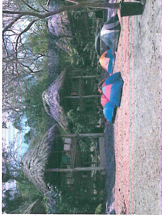
Figura 5: Zona de acampar en sitio Yaxha durante semana santa.

Se elaboró un informe sobre la afluencia de visitantes y situaciones presentadas durante el asueto de semana santa. Se recibieron 1613 visitantes nacionales, 539 extranjeros y 864 exonerados siendo el viernes el día más visitado (623 personas). Durante toda la semana solo se presentó respecto a los visitantes un incidente leve.