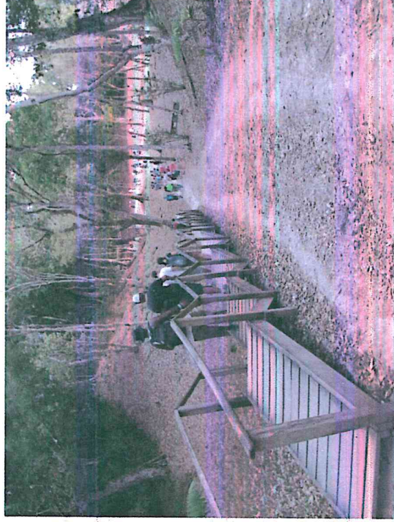
Figura 6: Escalinatas hacia el centro astronómico menor en semana santa.

Se desarrolló una propuesta de renovación de las escalinatas de madera de los sitios arqueológicos Yaxha y Topoxte tomando en cuenta las características de construcción de las escalinatas actuales.