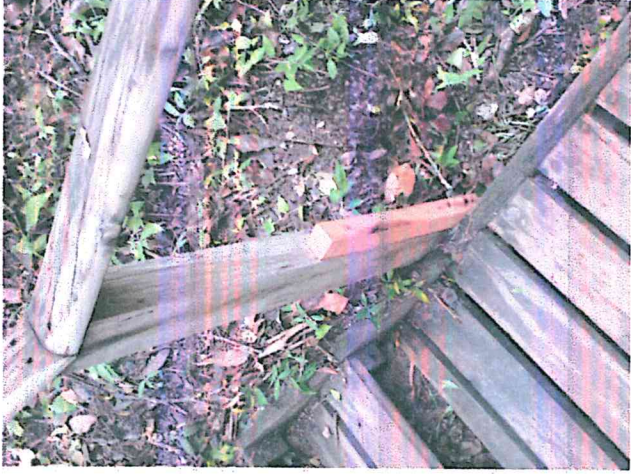
Fig.4: Trabajos de mantenimiento y mejoramiento escalinatas.