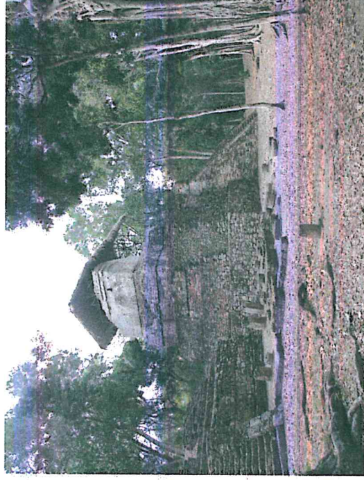
Figura 3: Templo C de Topoxte, estructura con techo protector

Los techos de las estructuras G y C de Topoxte requieren de mantenimiento con el fin de prevenir daños erosivos por la lluvia. La magnitud de las necesidades de mantenimiento es baja por lo cual es mejor atenderlo antes de que surja un daño mayor. En el sitio Yaxha ya se brindó mantenimiento a algunas cubiertas antes del inicio de la época lluviosa.