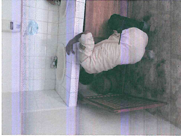
Figura 2: Revisión del funcionamiento de lavamanos del baño de mujeres en el grupo Maler

Se establecieron necesidades de mantenimiento en techos, baños, escalinatas. Los lavamanos de la Plaza Maler presentan fuga por la presencia de raíces en la tubería, lo cual requerirá de trabajos de albañilería. Las escalinatas de la calzada del lago requieren de un trabajo de mantenimiento con el fin de mejorar su aspecto y eliminar las tablas en mal estado que puedan causar accidentes.